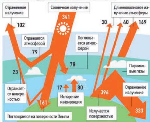
ЭНЕРГЕТИЧЕСКАЯ ДИАГРАММА ПАРНИКОВОГО ЭФФЕКТА (W/m 2 )